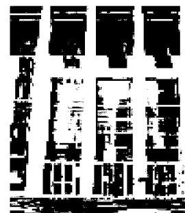
Processo Il tribunale

Le volontarie si opposero, ma alla recente udienza è stato ritirata l'opposizione al decreto che è rimasto valido.